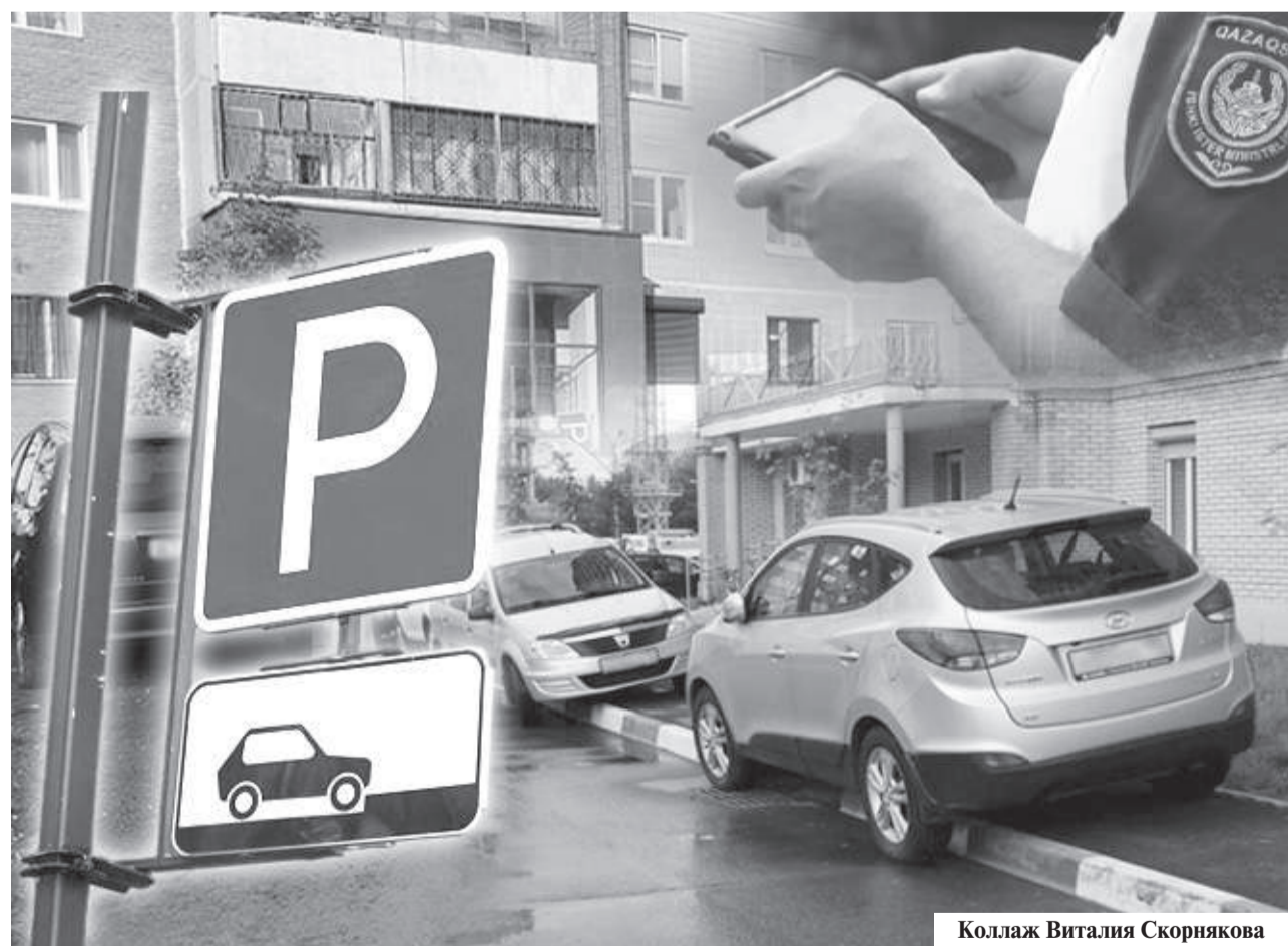
Коллаж Виталия Скорнякова

Таким образом, новые нормы не вводят запрет на парковку автомобилей, а призваны обеспечить порядок на территориях общего пользования, безопасность и удобство жителей.