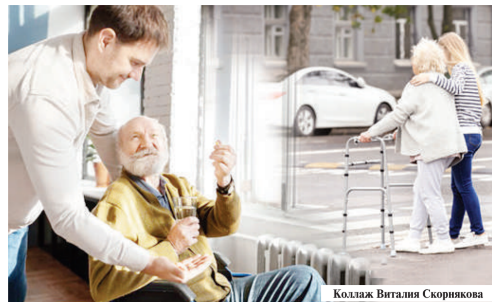
Коллаж Виталия Скорнякова

Одинокая старость пугает многих людей. Ведь даже наличие крепкой семьи и детей не является стопроцентной гарантией того, что на закате жизни найдется тот, кто подаст человеку стакан воды и согреет душевным теплом и заботой. Чтобы помочь пожилым людям справиться с элементарными бытовыми проблемами и немного скрасить их одиночество, общественный фонд «Волонтеры Кызылорды» инициировал социальный проект «Тепло рядом».