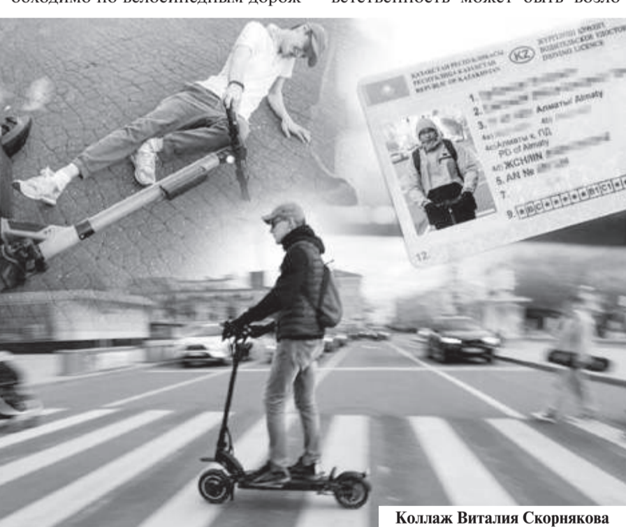
Коллаж Виталия Скорнякова

более мягкими. Им не нужно регистрировать транспорт, проходить технический осмотр или оформлять страховку. Однако соблюдать правила дорожного движения они обязаны так же, как и остальные участники движения. В частности, передвигаться на электросамокате необходимо по велосипедным дорож-