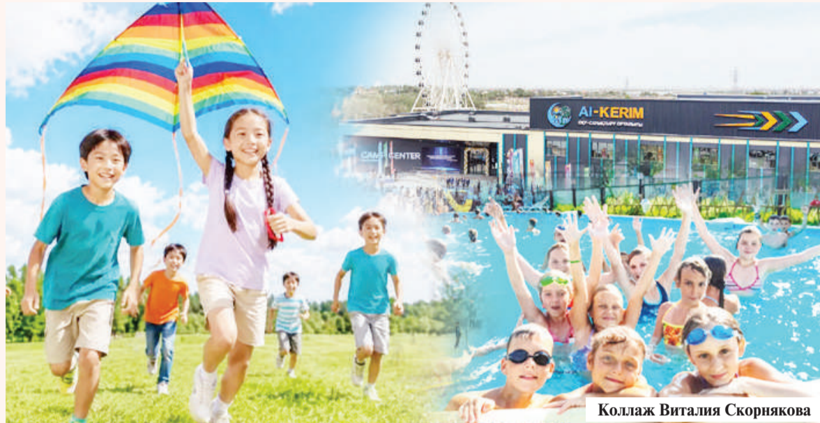
Коллаж Виталия Скорнякова

нут 829 ребят. Для сравнения: в прошлом году таким шансом воспользовались 542 школьника. Кроме того, в республиканский учебно-оздоровительный центр «Балдэурен» направят 774 ребенка, еще 4843 смогут отдохнуть за счет спонсоров и профсоюзных организаций. В общей сложности дополнительными мерами поддержки будут охвачены 6446 детей.