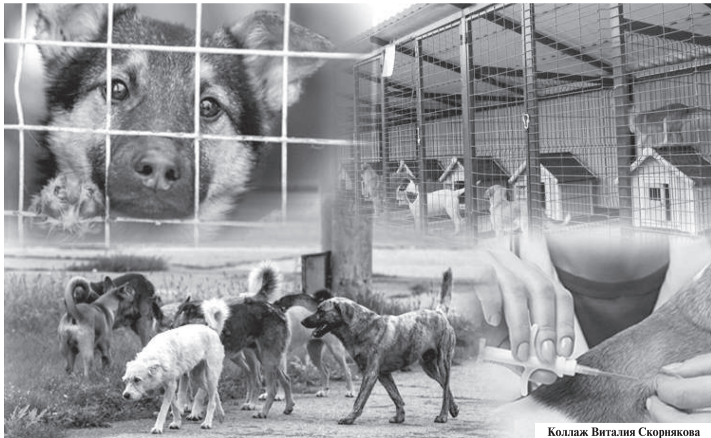
Коллаж Виталия Скорнякова

Таким образом, новые правила становятся важным шагом в формировании цивилизованного и ответственного отношения к животным. Речь идет не только о регулировании численности бродячих кошек и собак, но и о системном контроле за чипированием домашних питомцев. Обществу предстоит быстрее адаптироваться к новой модели, ведь государство уже перешло к более строгому мерам. Что будет дальше — покажет время, но очевидно одно: забота о наших братьях меньших становится частью общей культуры и социальной ответственности региона.