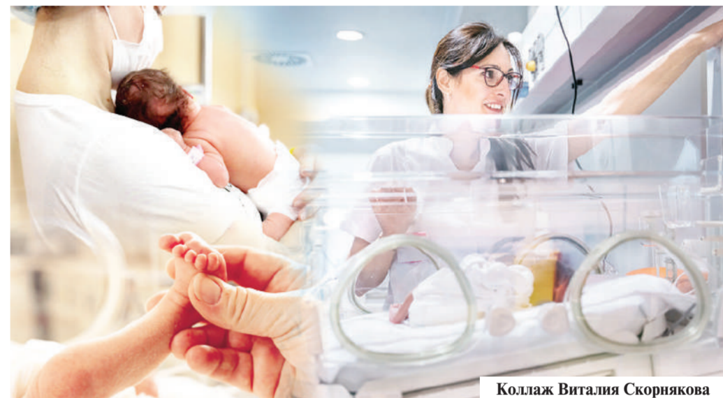
Коллаж Виталия Скорнякова

Как известно, с 2008 года Казахстан внедрил новые критерии Коценки жизнеспособности младенцев, рекомендованные Всемирной организацией здравоохранения в соответствии с Конвенцией о правах ребенка. Сейчас каждый малыш, появившийся на свет на сроке от 22 недель и весом не менее 500 граммов, имеет право на жизнь. Таким младенцам оказывают полный объем медицинских услуг, а для их выхаживания задействована команда специалистов и современное оборудование.