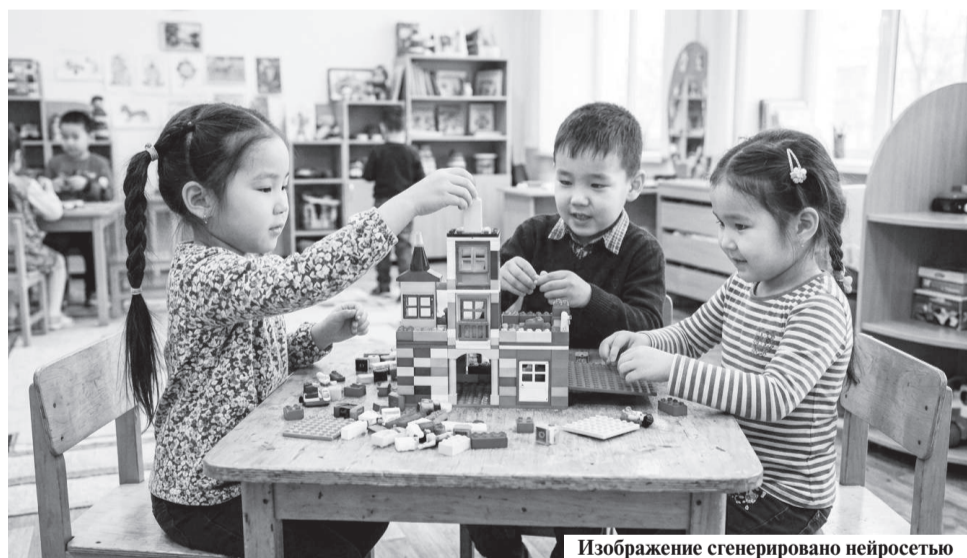
Изображение сгенерировано нейросетью

Параллельно совершенствуются меры господдержки в сфере дополнительного образования детей. Реформа работает по принципу «один ребенок — один ваучер», то есть один ребенок сможет посещать одну организацию и один кружок или секцию, оплачиваемые государством. При этом дополнительные занятия родители при желании смогут оплачивать самостоятельно. Универсальный ваучер дает семьям возможность