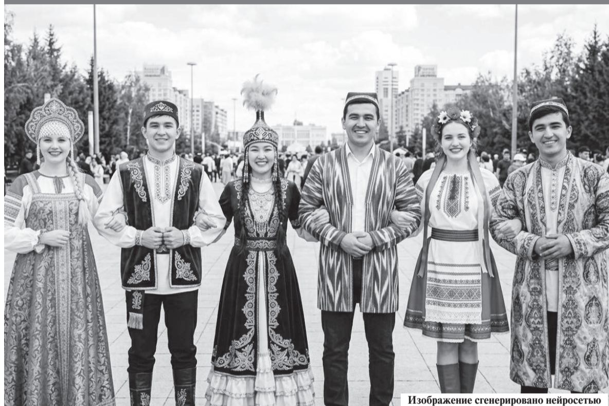
Изображение сгенерировано нейросетью

жительному отношению к людям, готовности помочь. И это действительно часть нашего характера. Я рад жить в стране, где мир и согласие являются главными ценностями. Для нас это не просто понятия, а прочный фундамент общества и залог будущего.