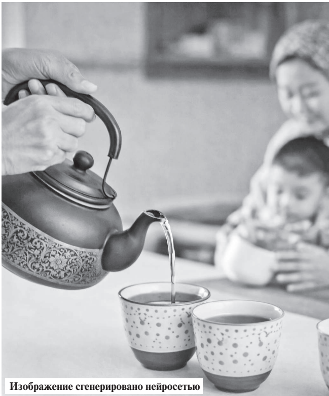
Изображение сгенерировано нейросетью

Потребителям рекомендуют проявлять бдительность при покупке чая и сверять данные на упаковке с перечнем запрещенных товаров. Наталья ЧЕРНЕЙ