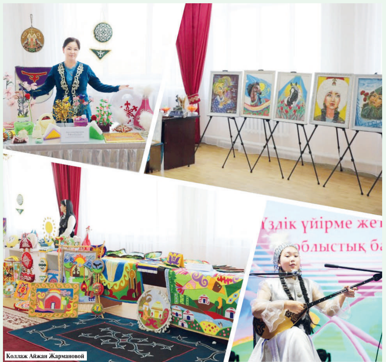
Коллаж Айжан Жармановой

Для размещения рекламы в областных газетах «Кызылординские вести» и «Сыр бойы», «Ақмешіт жастары», «Ақмешіт апталығы», а также в районных газетах, обращайтесь по телефонам: 40-11-10 (1058), 70-00-52, e-mail: smjarnama@mail.ru.