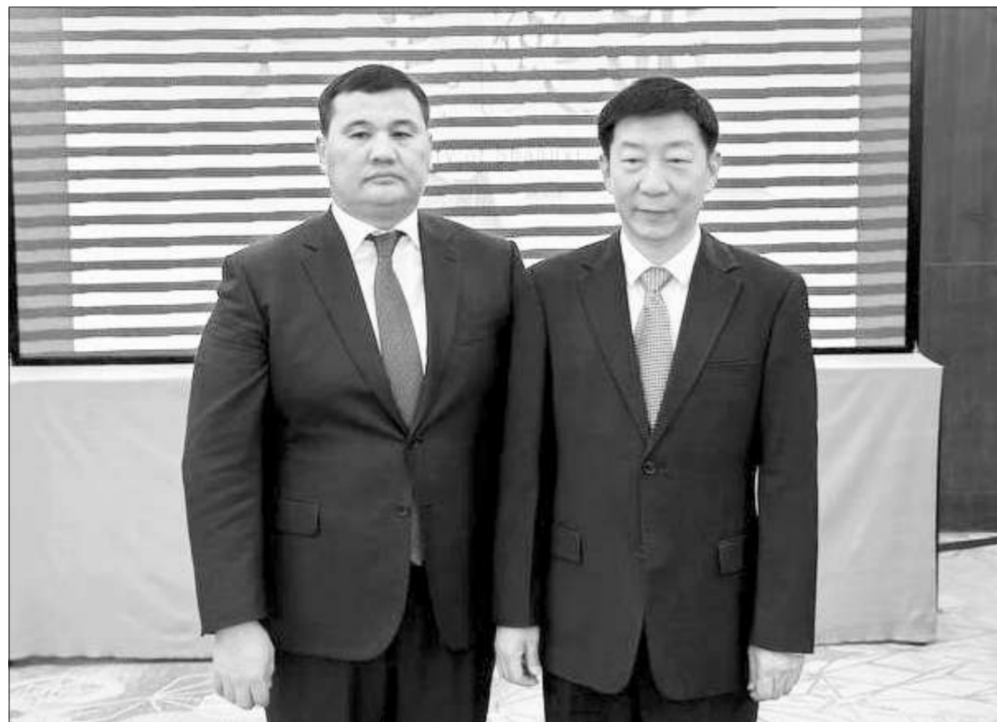
В рамках рабочей поездки в Китайскую Народную Республику аким области Нурлыбек Налибаев встретился с главой провинции Шэньси Чжао Ганом.

На встрече были обсуждены вопросы сотрудничества двух стран, развития торгово-экономического партнерства, привлечения инвестиций. — В соответствии с поручением Президента Казахстана по привлечению в отечествен-