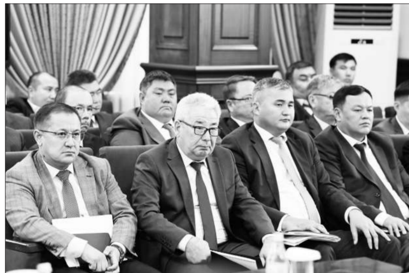
Во вторник после завершения заседания Правительства РК аким области Нурлыбек Налибаев провел совещание по вопросам подготовки к предстоящему отопительному сезону.

Отмечено, что на проведение реконструкции теплоисточников и тепловых сетей в нынешнем году из республиканского и местного бюджетов направлено 12 миллиардов тенге. Как сказал глава региона, необходимо своевременно и качественно провести все работы. С обеспечением тепла в предстоящий зимний период не должно быть никаких проблем.