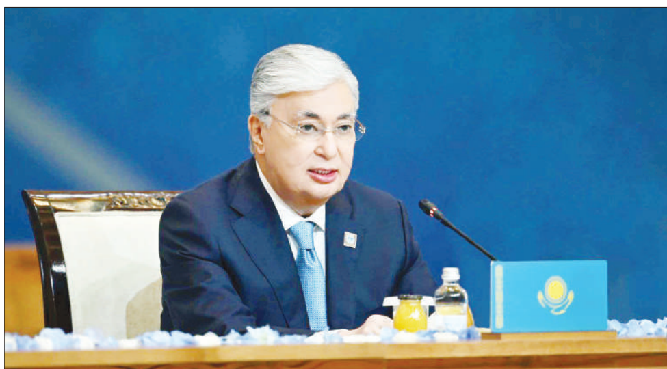
КАСЫМ-ЖОМАРТ ТОКАЕВ, ПРЕЗИДЕНТ РЕСПУБЛИКИ КАЗАХСТАН

На протяжении веков регион Центральной Азии выступал как единое геополитическое и духовное пространство, обладающее значительными природными ресурсами, мощным человеческим капиталом, богатым культурно-историческим наследием.