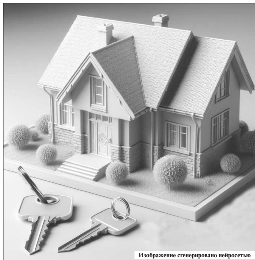
Изображение сгенерировано нейросетью

лучше 50 тысяч граждан. Разница в двух ипотеках заключается в том, что «Отату» предназначена только для вкладчиков «Отбасы банка», при этом срок депозита должен быть не менее 18 месяцев. Между тем программа