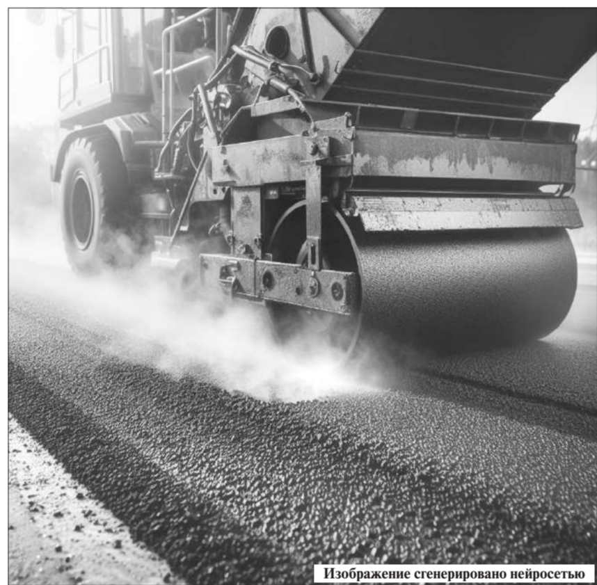
Изображение сгенерировано нейросетью

работы моста под железнодорожными путями на улице Жанкожи батыра, идет ремонт отрезка дороги от проспекта Н.Назарбаева до проспекта Независимости. Кроме того, начато строительство на проспекте Независимости автомобильного моста через канал Кызылжарма. Идет реконструкция улицы Кушербаева, а также работы по расширению отрезка