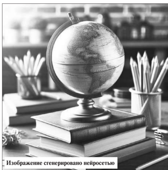
Изображение сгенерировано нейросетью

стями по состоянию здоровья. Из них 1468 детей получают образование в детских садах, 2214 – в школах, 1218 – дома, 299 – в специальных школах, 232 – в колледжах.