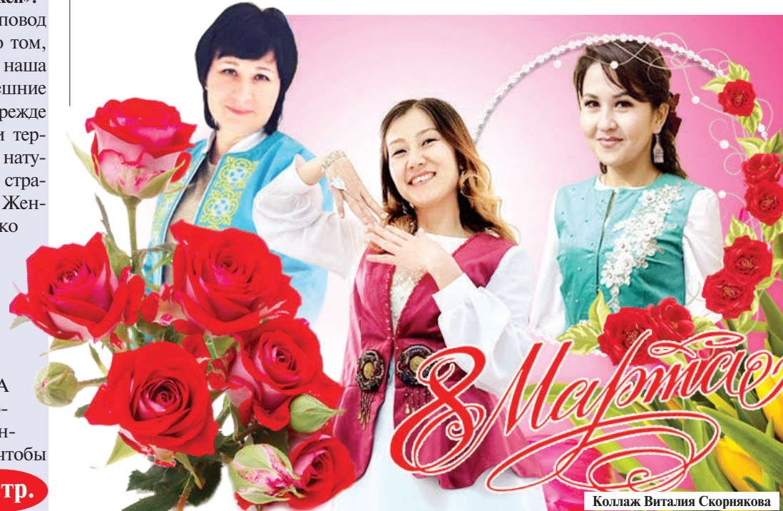
Коллаж Виталия Скорякова