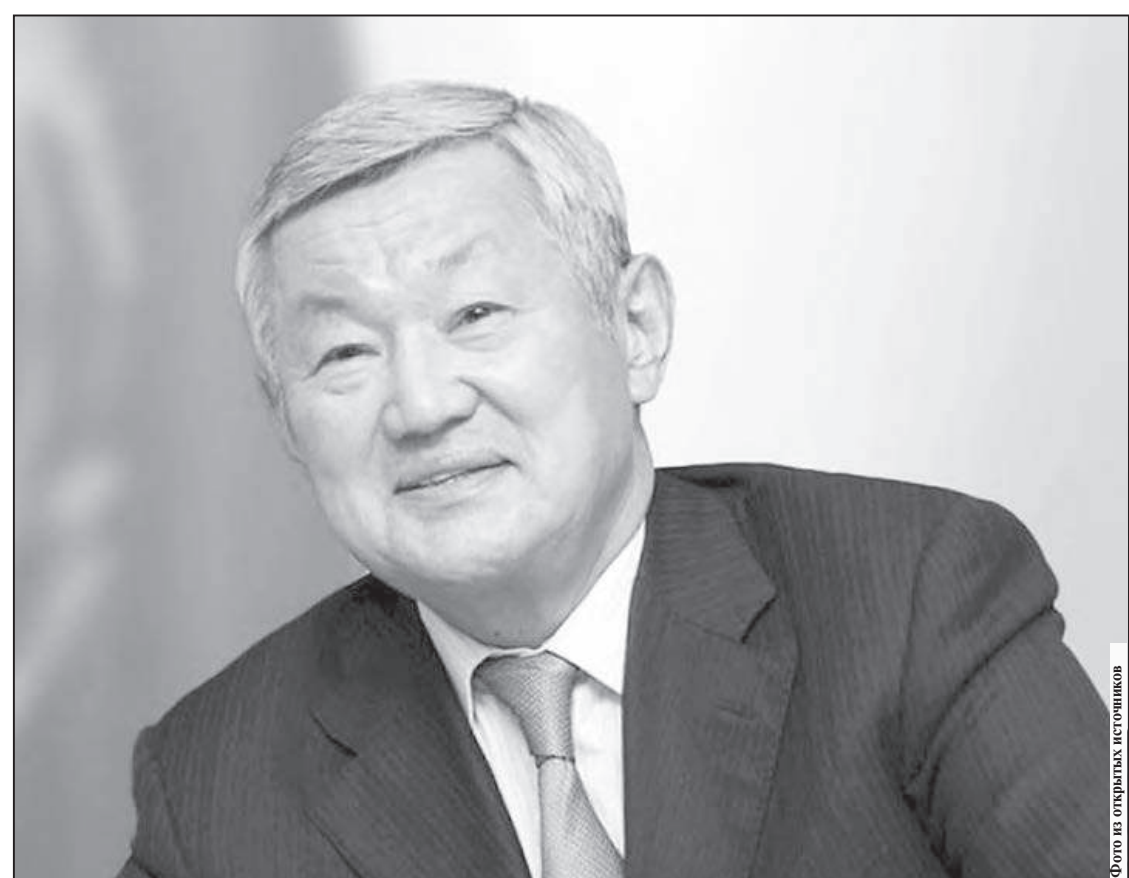
Фото по открыткам историков

Безвременный уход из жизни нашего земляка, государственного и общественного деятеля Бердибека Сапарбаева болью отозвался в наших сердцах. Горькая утрата еще раз напомнила нам о быстротечности жизни, о том, что мы не властны над временем.