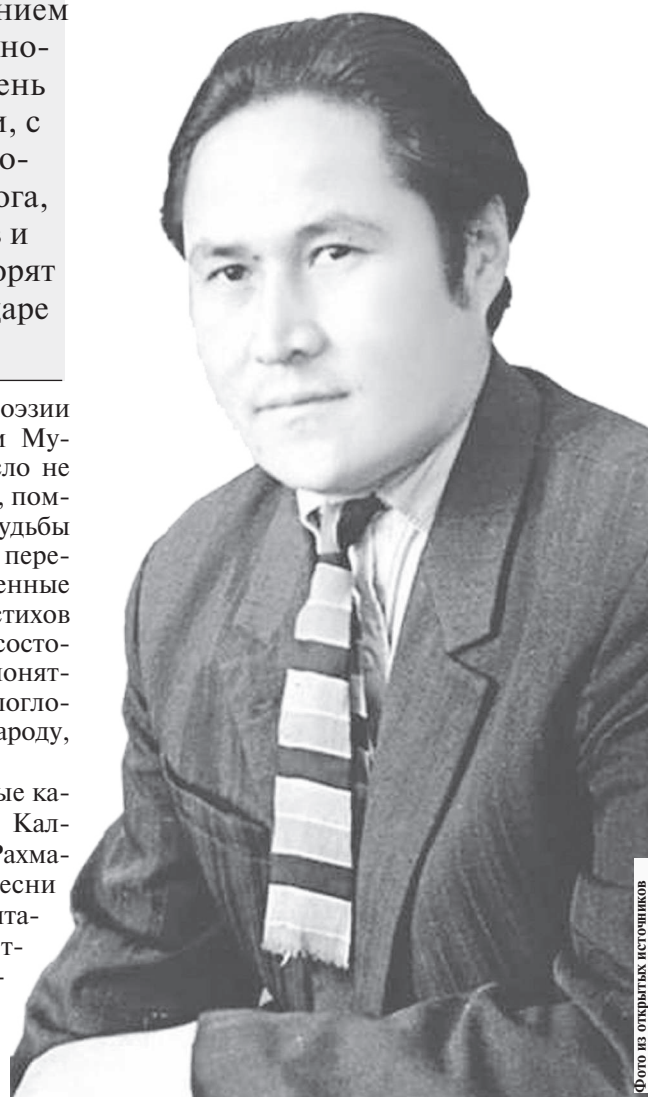
Фото по открыткам историков

«Непонимание человека — это мука, вдумчивому поколению за понимание спасибо. Вы молоды и в вас кипит пламя огня и много энергии...» — эти слова поэта были обращены к молодежи. Его творческое наследие находит понимание в сердцах людей разных возрастов, но сам он не был понят и оценен по достоинству при жизни. Слава и всенародное