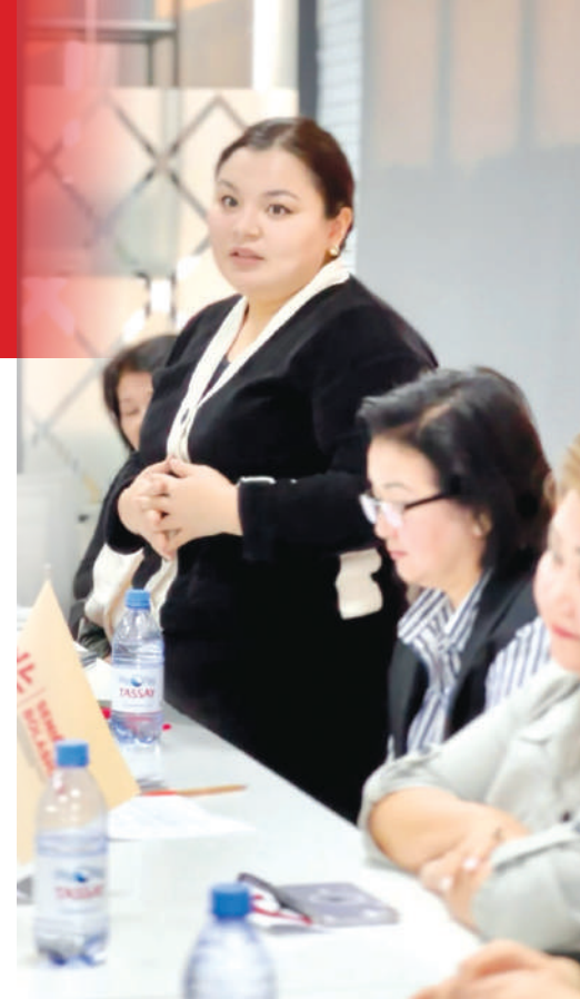
произведений казахского поэта и мыслителя Машхура Жусупа. Книги бесплатно распределили по 40 учреждениям по всей стране.

Объединение также немало внимания уделяет просветительской работе, издает произведения алашской интеллигенции. А в мае 2023 года при поддержке РОО «Сенімен Болашак» издан пятитомник ранее не опубликованных