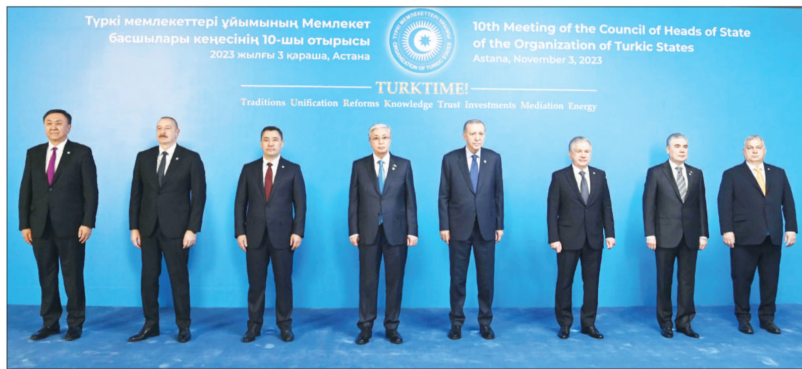
Түркі мемлекеттері ұйымының Мемлекет басшылары кеңесінің 10-шы отырысы 2023 жылғы 3 қараша, Астана