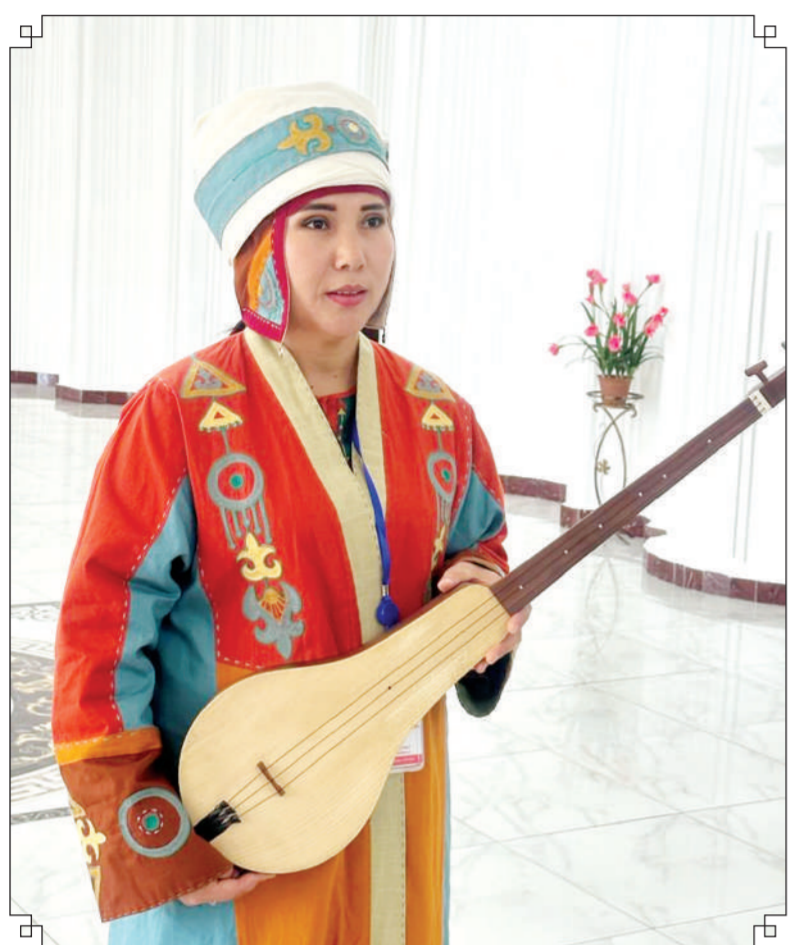
← стр. 1 Это яркое свидетельство вечности бесценного наследия нашего легендарного предка Коркыта и искусства Великой степи.

Нынешний международный фестиваль совпал с празднованием 85-летия Кызылординской области, занимающей особое место в истории независимого Казахстана. Наш край, известный как «Сыр елі – жыр елі», выполняет особую роль в вопросах культурного развития. Как отметил аким области, в этом году представителями искусства и литературы, внесшим вклад в развитие культуры Приаралья, впервые была вручена специальная награда «Тұран».