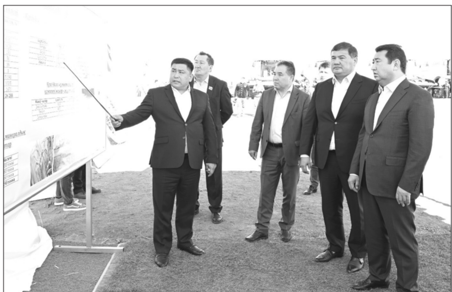
рочная кампания должна завершиться 10 октября.