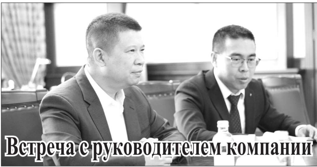
Встреча с руководителем компании