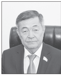
Кылышбай БИСЕНОВ, доктор технических наук, профессор, академик НАН РК:

–Нынешнее Послание Главы государства не зря называется «Экономический курс Справедливого Казахстана». Президент подробно изложил новую экономическую стратегию развития страны. Он особо подчеркнул, что она должна обеспечить оптимальный баланс развития человеческого капитала. Отмечено также, что это исторически важный момент, который характеризует в том, что в глобальной экономике, в частности, в международной системе разделения труда, происходят большие изменения. В настоящее время актуальными проблемами становятся изменение климата, продовольственная безопасность, демографическое развитие. Поэтому Президент подчеркнул, что необходимо поэтапно претворять в жизнь новую экономическую модель, во главе которой будет реальное улучшение качества жизни казахстанцев.