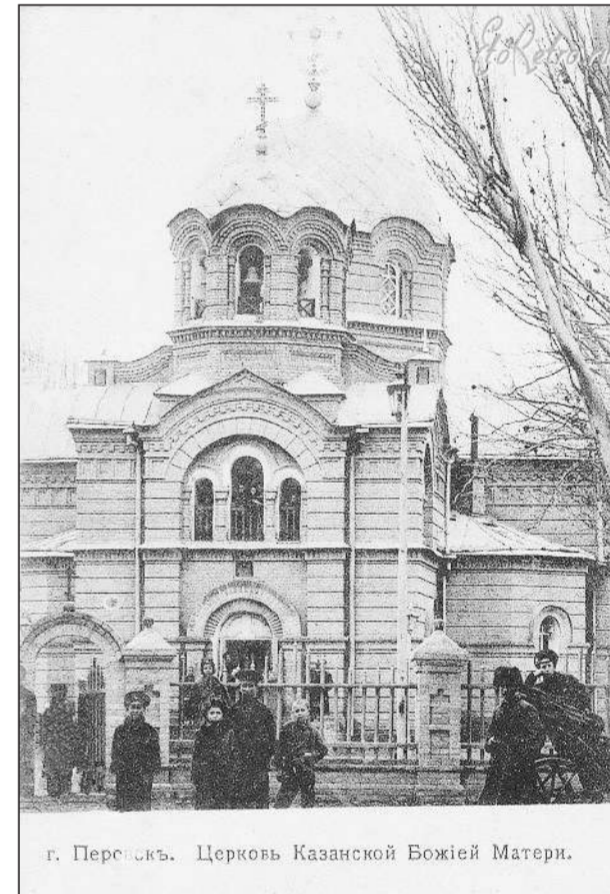
г. Перовск. Церковь Казанской Божией Матери.