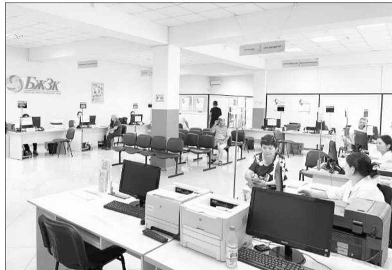
разъяснительная работа в 544 организациях города.