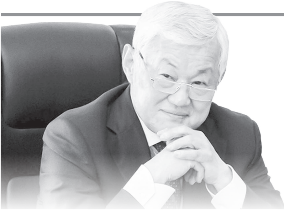
Прошло 40 дней, как не стало уроженца земли Сыра, видного политического и государственного деятеля Сапарбаева Бердибека Машбековича.