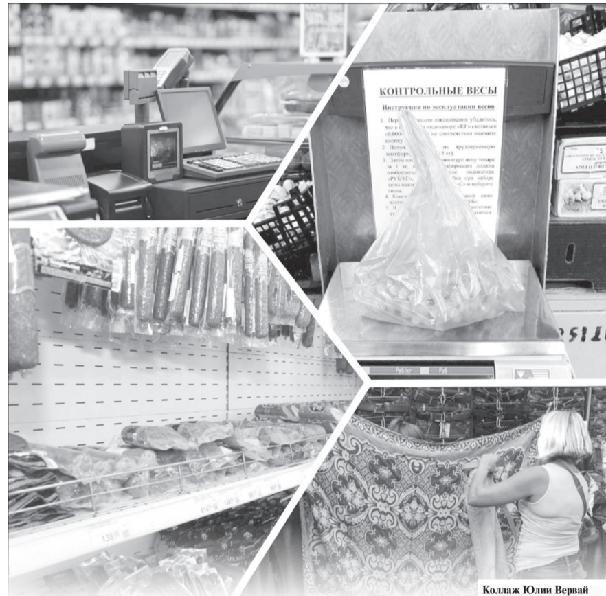
Коллаж Юлии Верной

– Неизменными остались требования о наличии в каждом продовольственном торговом зале контрольных средств измерений, а также документов подтверждающих качество продукции. Оригиналы накладных и другие предусмотренные нормативными актами товаросопроводительные документы, подтверждающие соответствие и безопасность товаров, хранятся у