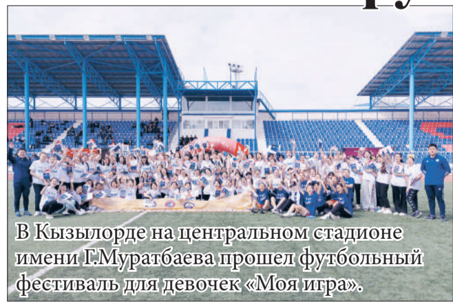
В Кызылорде на центральном стадионе имени Г.Муратбаева прошел футбольный фестиваль для девочек «Моя игра».

В состязаниях, организованных по инициативе Казахстана совместно с Национальным научно-практическим центром МОН РК, местной федерацией футбола и региональным методическим центром физкультуры, приняли участие 150 учениц школ города в возрасте 7-14 лет. Под руководством опытных наставников