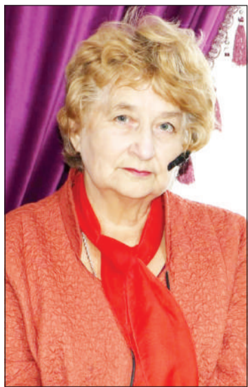
бири «занесло» в наш город.

...В местных школах не хватало учителей, поэтому ее забрали прямо с подножки автобуса. Девушку ждали чудесные создания с милыми румянцами на щеках, любознательные, преисполненные желания знать все на свете. Расположили учителей в общежитии. Как оказалось, здесь жили студенты из разных городов, в том числе и несколько ребят из Кызылорды. Там и произошла встреча, определившая всю ее дальнейшую жизнь. Будущий муж окончил учёбу по гидротехнике и мелиорации, работал на стройке. Вскоре они поженились и переехали в Кызылорду. Вот так девушку из Си-