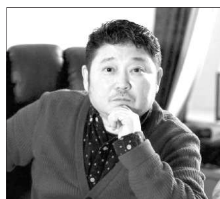
Рустем АБДРАШЕВ, кинорежиссер, сценарист, художник, заслуженный деятель РК (Астана):

— Для меня Кызылорда — город, который особенно дорог. Это малая родина моих предков, именно в Кызылординской области берут начало корни моих предков. И хотя отца уже нет рядом, время от времени посещаю Кызылординский регион. Родился и вырос в Алматы, но Кызылорда всегда была мне близка. Помню, еще в годы студенчества, по пути в Москву, проезжая станции «Кызылорда» и «Аральск» всегда выходил из поезда, чтобы вдохнуть полной грудью запах этого края. Помню вокзал в старинном стиле, который должно быть с точки зрения архитектуры имеет историческую ценность.