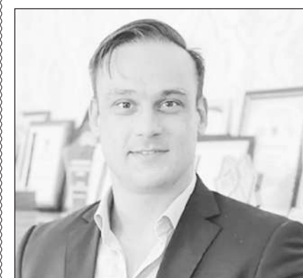
Илья ИЛЬИН, четырёхкратный чемпион мира по тяжелой атлетике, заслуженный мастер спорта РК, кавалер ордена «Құрмет» (Астана):

– Поздравляю мой родной город Кызылорду и всех его жителей с Днем рождения! Любимому городу пожелаю главного – спортивного, культурного и экономического процветания! Хочу, чтобы областной центр рос, развивался и хорошел, а кызылординцам – благополучия, чтобы дети нас радовали, дедушки и бабушки, родители были здоровы, а мы все – счастливы! Удачи нам всем, удачи нашему родному городу!