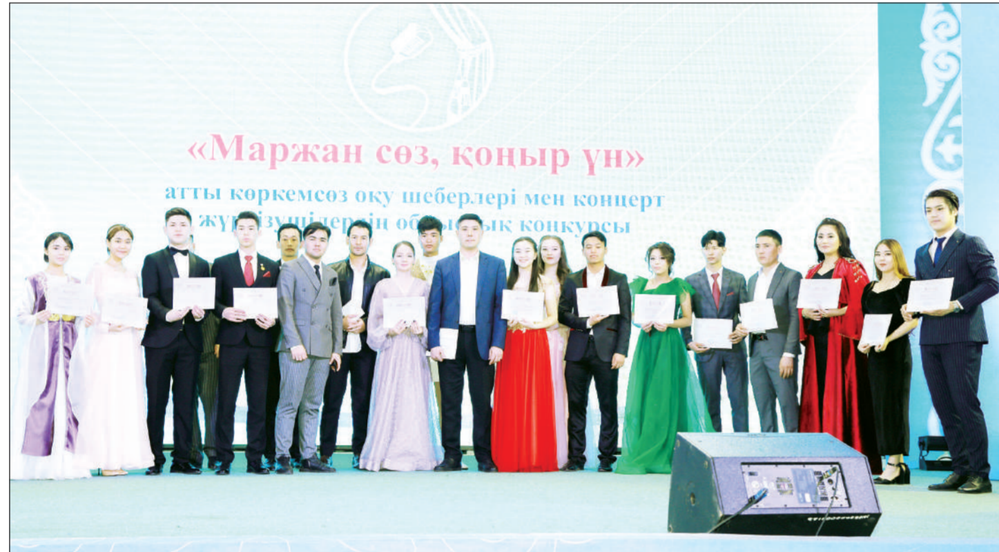
«Маржан сөз, коңыр үн»

агты көркем сөз оқу шеберлері мен концерт жүргізушілерінің облыстық конкурсы