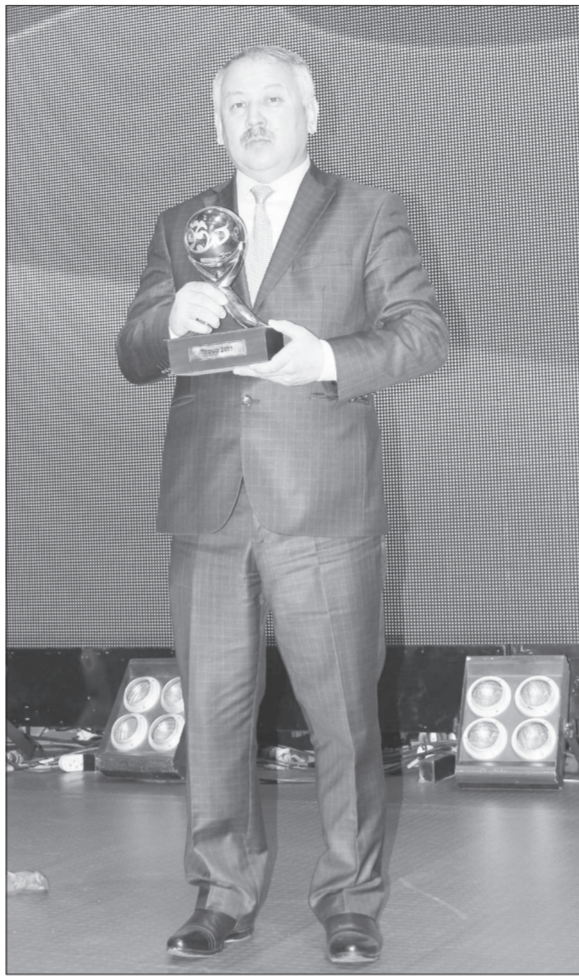
сударств за достижение в области качества продукции и услуг.

И доказательством того является ПТ «Абзал и К». За 27 лет своей деятельности компания постоянно наращивает объемы производства и выпуска качественной продукции, завоевывая самые важные и престижные награды нашей страны и за рубежом. Так, в арсенале компании победы в республиканских конкурсах, учрежденных Президентом РК: «Лучший товар Казахстана», «Парыз», «Алтын сапа» и важнейшая международная награда конкурса на соискание Премии Содружества Независимых Го-