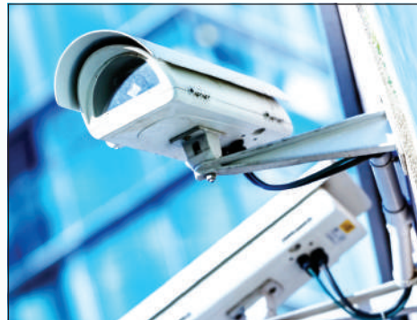
Камеры наблюдения, установленные в областном центре. За всем происходящим на монито-

С первого февраля 2021 года для экстренного реагирования на различные правонарушения в органах внутренних дел введен новый сервис для граждан — мобильное приложение «102».