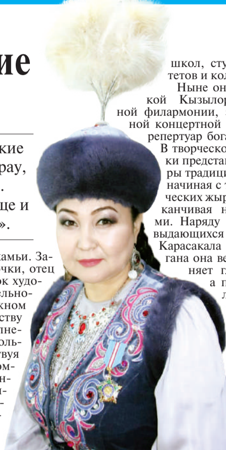
школ, студентам университетов и колледжей.

На земле Приаралья на протяжении нескольких столетий сформировался целый пласт поэтического искусства жырау, чье творчество можно назвать вершиной словесного искусства кочевых казахов.