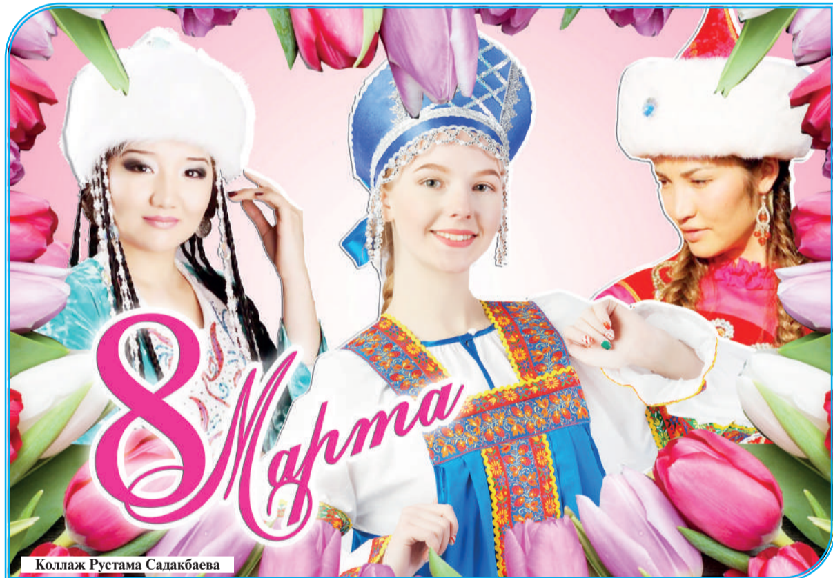
Коллаж Рустама Садакбаева