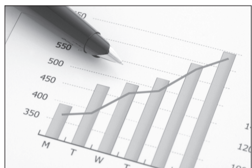
го благополучия граждан.

В Послании Глава государства делает упор на развитие экономики в новых реалиях, раскрытие промышленного потенциала, развитие сельского хозяйства, транспортно-логистического комплекса, малого и среднего бизнеса, финансовой сферы, модернизацию территориального развития страны, повышение социально-